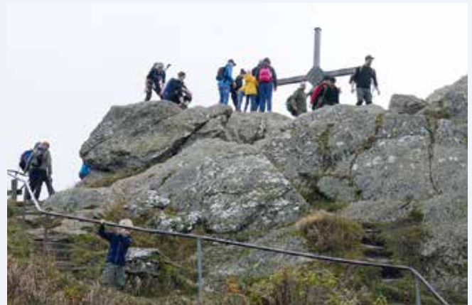
Die 2. Themen-Wanderung zu den 8 Tausendern führte 2021 auf den Großen Osser

Mit der 3. Themen-Wanderung „8 Tausender“ beendet Griesbachs Alpenverein am Sonntag, 16. Oktober , die Touren-Saison 2022. Zusammen mit den Bergfreunden der Ortsgruppe Pocking geht es im Bayerischen Wald hinauf zum Großen und Kleinen Falkenstein. Der Aufstieg beginnt in Zwieslerwaldhaus im Landkreis Regen. Nach eineinhalb Stunden Wanderzeit ist der Ruckowitzschachten mit den eingezäunten Weideflächen und den für die Schachten typischen, alleine stehenden Ahornbäumen erreicht. Weiter geht es aufwärts und nach einer weiteren Stunde stehen die Teilnehmer auf dem Gipfel des Großen Falkenstein (1.315 m) mit dem neu erbauten Schutzhaus. Nach einer Einkehr machen sich die Bergfreunde auf den Weg zum Kleinen Falkenstein (1.190 m), der wegen seiner herrlichen Aussicht ein absolutes Muss ist. Über den „Adamssteig“ wandert die Gruppe dann zurück zum Ausgangspunkt in Zwieslerwaldhaus.