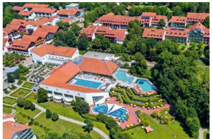
Die Wohlfühl-Therme Bad Griesbach würde wie alle fünf Bäder der niederbayerischen Thermengemeinschaft bei einem Gaslieferstopp vor existenzielle Herausforderungen gestellt werden.