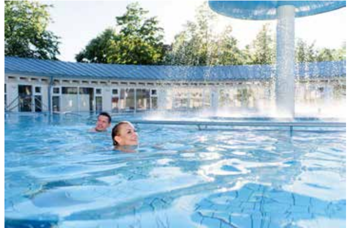
Therme in Bad Füssing.