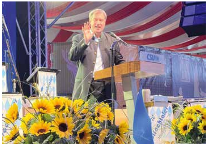
Ministerpräsident bei seiner Ansprache.