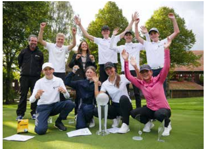
Jubel! Die Golf-Jugend des Golf Resort Bad Griesbach ist Niederbayerischer Mannschaftsmeister.