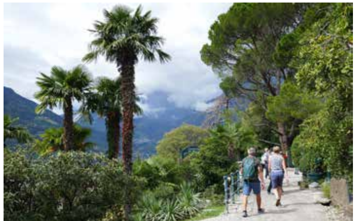
Auf dem Tappeiner Höhenweg in Meran

als sie zum Inn-Tiefblick auf der Westseite wanderten. Hier, wo der junge Inn durch eine wilde Schlucht tost, fielen die Felswände mehrere hundert Meter fast senkrecht in die Tiefe ab. Die anschließende Wanderung auf dem verwurzelten Kaiserschützenweg hoch über Nauders ließ die Bedeutung des Reschenpasses als Alpenübergang spüren und man konnte erahnen, wie sich das Leben während des ersten Weltkriegs hier abspielte. Der spannendste Teil des Wanderwegs waren die begehbaren Felskavernen, die den treuen Soldaten, den sog. „Kaiserschützen“, als Unterkünfte dienten. Über die Selsköpfe ging es dann zurück zum Ausgangspunkt, wobei die Bergfreunde zu guter Letzt