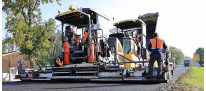
Messgeräte „am Mann“ und eine Absaugeinrichtung am Fertiger dienen der Erprobung des Einbauverfahrens mit temperaturabgesenktem Walzasphalts. Diese findet bei der aktuellen Sanierung der B 388 bei Karpfham statt.

Mit dem Einbau von temperaturabgesenktem Walzasphalt