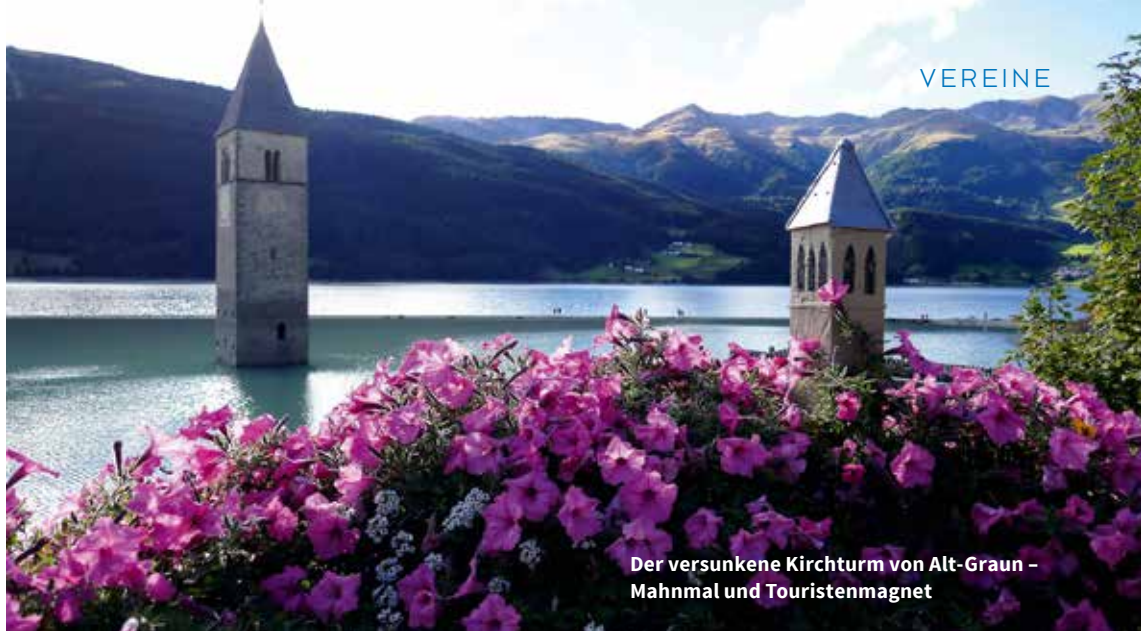
Der versunkene Kirchturm von Alt-Graun – Mahnmal und Touristenmagnet