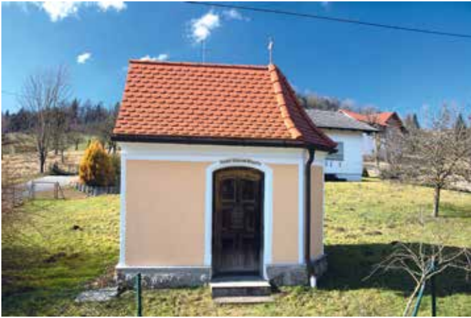
Die kleine Bruder-Konrad-Kapelle in Niederweng ist einen Abstecher wert.