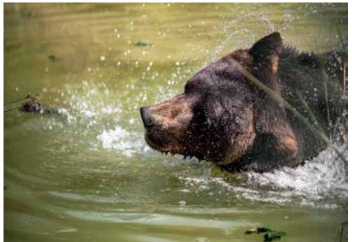
Ausgiebiges Waschen nach der Winterruhe tut gut ;) Letzter Zirkusbär Deutschlands „Ben“ genießt sein freies Leben