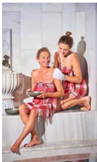
Das Wesen des Hamams ist sowohl Reinigung und Körperpflege, als auch Gesundheit und Kur.

kengymnastik eine Form der äußeren Anwendung von Heilmitteln bei der die Funktionsfähigkeit des menschlichen Körpers erhalten, verbessert und wiederhergestellt werden soll. Die erfahrenen Therapeutinnen und Therapeuten gehen hierbei mit ihrem umfangreichen Fachwissen individuell auf ihre Beschwerden ein und behandeln diese befundgerecht. Einsatzbereiche: Schmerzen, Bewegungseinschränkungen, muskuläre Verkürzungen/ Verspannungen, posttraumatisch, postoperativ, präventiv, Gleichgewichtsstörungen, Arthrose. Termine können telefonisch unter 08532 96150 vereinbart werden oder auch