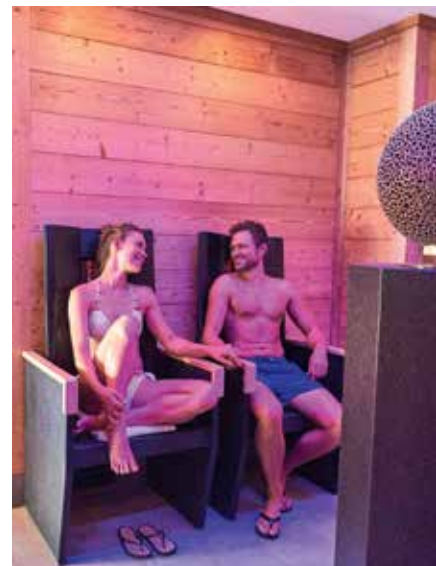
Tuen Sie Ihrem Körper was Gutes und entspannen Sie in der Infrarotkabine.

Die Salzgrotte ist mit Salz vom Toten Meer ausgekleidet, hier atmen Sie Gesundheit. So kommt das einzigartige Klima des Toten Meeres direkt in die Wohlfühl-Therme Bad Griesbach. Ein Aufenthalt stärkt die körperlichen Abwehrkräfte und tut einfach gut. Das mit feinsten Salzpartikeln angeereicherte Heilklima wirkt positiv auf Geist und Körper.