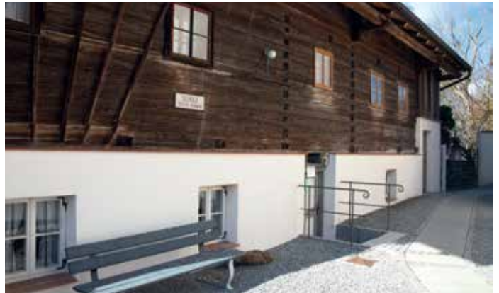
Hier drückte der heilige Bruder Konrad von 1824 bis 1830 die Schulbank, von hier aus startet unsere Tour.

„Wandern drent und herent“ startet exakt dort, wo der heilige Bruder Konrad von Parzham die Schulbank drückte. Das alte Schulgebäude in Weng am Fuße der Pfarrkirche St. Johannes der Täufer ist gründlich hergerichtet. Außen zielt ein kleines Schild mit der Aufschrift „Schule des Hl. Konrad“, davor steht eine Bank, die zum Verweilen einlädt. Heute zählt das alte Schulhaus zu den kirchlichen Einrichtungen, es beherbergt das Pfarrbüro und Sitzungsräume, wie uns die Internet-Seite des Pfarrver-