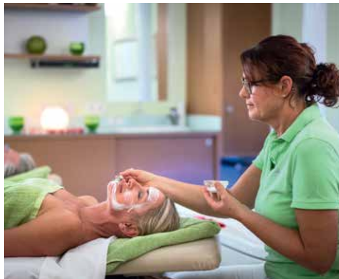
Lassen Sie sich im Kosmetikstudio mit ganzheitlichen Behandlungsmethoden und ausgewählten Kosmetikprodukten verwöhnen.