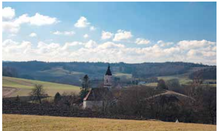
Ein Blick zurück auf St. Wolfgang.

dritten Mal entscheiden wir uns für links. Am Wald entlang geht es weiter, wir schauen auf Niederweng. Erneut treffen wir nach einiger Zeit und vorbei an einer Pferdekoppel auf die PA 72, in die wir links einbiegen. Wer hier einen kleinen Abstecher unternehmen will, kann rechts abzweigen. Schon nach wenigen Schritten kommt man zu einer Bruder-Konrad-Kapelle. Die Hofkapelle ist offen. Die Liste der Baudenkmäler bezeichnet sie als „traufständiger und polygonal schließender Steildachbau mit Putzgliederungen, 19. Jahrhundert“. Eine schmiedeeiserne Arbeit in der Holztür weist uns auf das Jahr 1932 hin – wir befinden uns also zeitlich in der Mitte zwi-