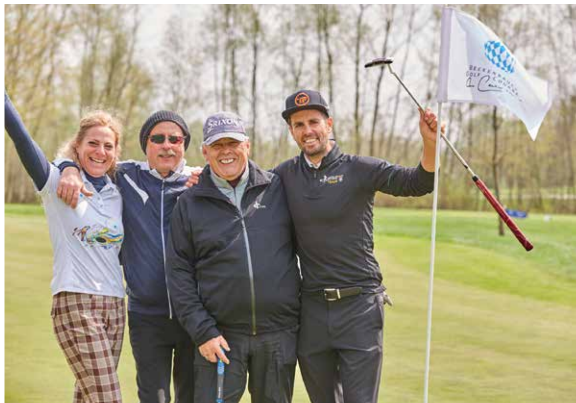
Traditioneller Start in die Golf-Saison mit viel Spaß und guter Laune: das Golf Opening mit dem EAGLES Charity Golf Club im Quellness & Golf Resort Bad Griesbach.

Im Mittelpunkt des Golf Resort Bad Griesbach befindet sich das Trainingszentrum Golfodrom®. Hier beginnen mit dem Saisonstart auch wieder die kostenlosen Angebote: Das Schnuppergolfen findet jeden Dienstag von 15 bis 16 Uhr statt, am Sonntag,