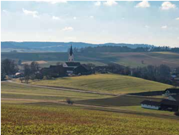
Zum Ende der Tour weist uns die Kirche St. Johannes der Täufer den Weg.

schen der Seligsprechung am 15. Juni 1930 und der Heiligsprechung, die am 20. Mai 1934 stattgefunden hat.