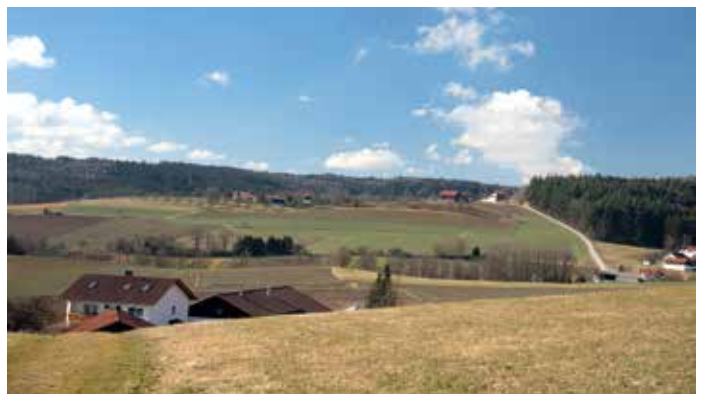
Ein Blick in die Landschaft bei St. Wolfgang.