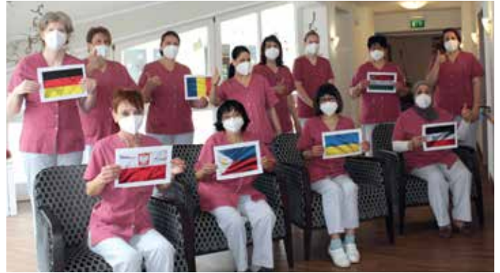
Das Bild entstand im Rahmen des Projekts Kulturbegleitung im Passauer Wolf Nittenau. Das Passauer Wolf-Team setzt sich seit längerem für Zusammenhalt, Gemeinschaft und ein friedliches Miteinander ein.

Aus dem Mitarbeiterkreis wurden bereits spontan einige Hilfsangebote realisiert. So rief das Passauer Wolf Senioren-Zentrum Nittenau eine Spendenaktion zur Unterstützung der Familien und Freunde der ukrainischen Mitarbeitenden ins Leben. Die gesammelten Sachspenden sind bereits auf dem Weg in die Ukraine, wo sie an Hilfsbedürftige verteilt werden. Der Passauer Wolf Bad Gögging