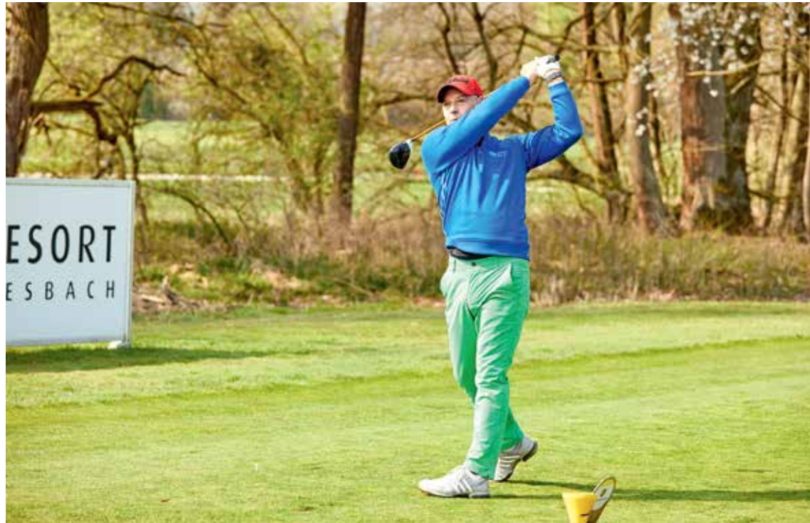
Es ist ein tolles Gefühl, wenn der Ball gut getroffen wird und richtig weit fliegt: Schauspieler Simon Licht beim Abschlag auf dem Porsche Golf Course in Penning.