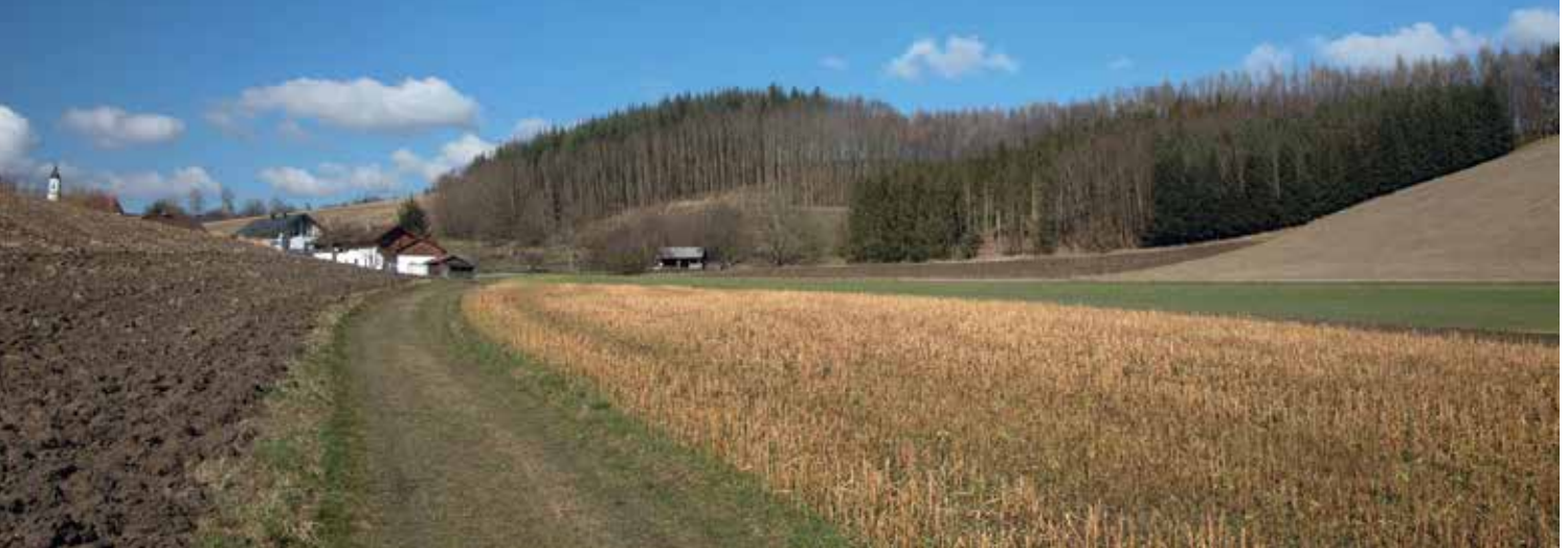
Dann geht es quer durch die Fluren. Am linken Bildrand spitzt der Turm der Wallfahrtskirche St. Wolfgang hervor. Er ist das nächste Zwischenziel.

– vor uns liegt nun ein Marsch durch die Fluren rund um Weng. Ein Blick zurück lohnt, das Ensemble um die Pfarrkirche wird von Obstbäumen gesäumt. Was mag das erst für ein Bild sein, wenn sie in wenigen Wochen in voller Blüte dastehen? Unser Weg führt uns nach einiger Zeit wieder auf eine asphaltierte Straße. Längst haben wir die Wallfahrtskirche St. Wolfgang im Visier und biegen rechts in die Straße ein, die uns geradewegs in den kleinen Ort führt. Hier wurde Bruder Konrad am 22. Dezember 1818, also noch am Tag seiner Geburt, getauft. Gleich vis a vis der Kirche biegen wir rechts ab, bei der nächsten Gabelung halten wir es ebenso, beim