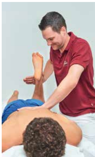
In der Physio-Abteilung werden Ihre Beschwerden vom Fachpersonal befundgerecht behandelt.

In der Physio-Abteilung werden verschiedene Behandlungsmethoden angeboten. Zum Beispiel ist die Kran-