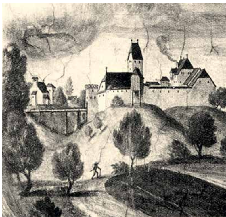
Ehemaliges Schloss Griesbach, Gemälde von Hans Donauer um 1590.

Rottal eine Burg, eine Herrschaft oder nur irgend ein Grundstück, noch die für die Ausübung einer Herrschaft damals notwendigen Rechte, Grafschaft und Vogtei, womit die Ausübung der Gerichtsbarkeit verbunden war. Die Mächtigen des Rottals waren die Herzöge und Grafen von Andechs-Meranien, die zunächst Griesbach von den Vornbachern erben, und die Grafen von Ortenburg (ab 1231 in Griesbach). Bis 1250 gelang es den Wittelsbachern, die Ortenburger abzulösen. In einer Urkunde von 1260 vergibt bereits der Herzog den Zehnten von den erworbenen Besitzungen, darunter auch von Griesbach. Im Jahr 1248 stirbt auch Herzog Otto II. von Andechs-Meranien geächtet und kinderlos. Seine Herrschaften Neuburg und Schärding werden an Herzog Otto II. von Bayern verliehen. Nun hat der Herzog mit den Grafenburgen die hohe Gerichtsbarkeit, das Zubehör der Burgen, d.h. gut 10 % aller Bauernhöfe im neuen Landgericht (hauptsächlich um Rotthalmünster und Griesbach) und durch die Vogtei-rechte über die kirchlichen Güter die niedere Gerichtsbarkeit über 40 % aller Untertanen.