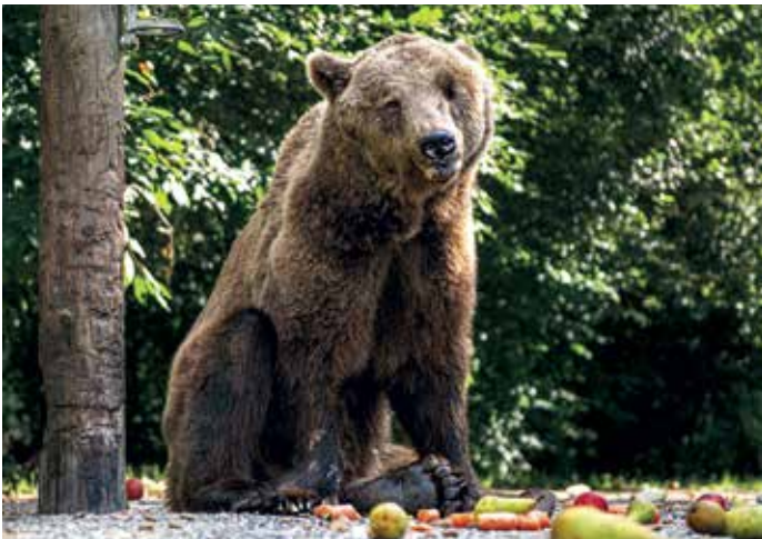
Unser Goliath muss jetzt allein seinen Lebensabend verbringen.

meistens zugunsten von der kleinen aber recht temperamentvollen Bärendame. Sie zählte körperlich nicht zu unseren größten Bären, aber sie war auf mentaler Ebene sehr stark und wusste sich dennoch sehr gut durchzusetzen, das wusste auch der dreimal so schwere Goliath mit der Zeit und legte oft schon mal den Rückwärtsgang ein, wenn sie kam. Die Bärin war immer eine sehr gute Eslerin und wir mussten uns nie Sorgen machen, dass sie für die anstehende Winterruhe zu wenig Gewicht hätte. Ganz liebevoll nannten wir sie oft „Bugel“, halb Bär, halb Kugel. Das Wichtigste ist, dass sie bis zum Schluss nach ihrer vergangenen Käfighaltung ein wunderschönes artgerechtes Leben ohne Schmerz und ohne Leid bei uns im Gnadenhof für 13 Jahre haben durfte. So wie der Name Franzi (abgl. Franziska) die Freie bedeutet, darf sie jetzt auch wieder völlig frei sein, freispielend hinter der „Regenbogenbrücke“. Mach's gut, liebe Franzi. Wir werden dich vermissen.