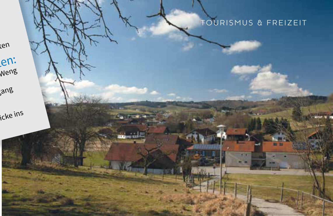
Gleich zu Beginn schauen wir auf das Hügelland, das wir nachfolgend auf sieben Kilometer Länge durchstreifen.

Bruder-Konrad-Schulhaus Weng Pfarrkirche Weng Wallfahrtskirche St. Wolfgang Bruder-Konrad-Kapelle in Niederweng Sehr viele schöne Ausblicke ins Hügelland