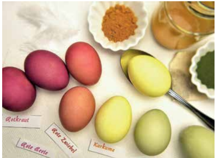
Eier lassen sich prima mit Naturprodukten färben, das schont Umwelt und Gesundheit. Man benötigt allerdings etwas mehr Zeit.

Beim Eierfärben mit Naturprodukten benötigt man etwas länger Zeit. Im ersten Schritt sollte man die Eier mit Essigwasser reinigen. Dadurch kann die Farbe besser aufgenommen werden. Ein weiterer Tipp ist, die richtige Auswahl der Eier. Bei weißen Eiern entwickelt sich die Farbe meist schöner als bei