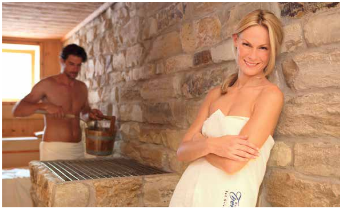
Schön Schwitzen und die Wärme genießen können Sie in den drei Saunen mit 60°C, 75° C und 95° C.

Traum, Sinnlichkeit und Glück, ein Ort traditioneller orientalischer Badekultur und ein Erlebnis, das Ihre Sinne belebt. Das Wesen des Hamams ist sowohl Reinigung und Körperpflege, als auch Gesundheit und Kur. Es dient zudem als Treffpunkt für Gemeinschaft und Zusammengehörigkeit. Tauchen Sie ein, in eine faszinierende Welt und begeben Sie sich auf eine sinnliche Reise nach Fernost. Diese Wirkung stärkt auch präventiv die Gesundheit.