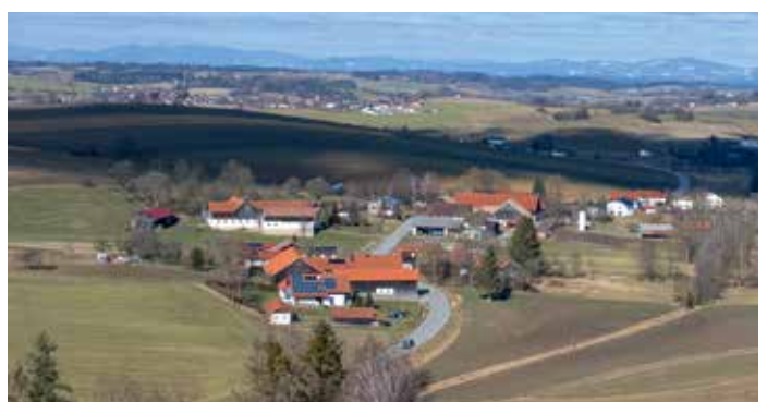
An dieser Stelle kann man durch die Neuanpflanzung hindurch einen Blick auf Schnellertsham mit sehr schöner Fernsicht erhaschen. Die Drohne verleiht uns einen noch etwas besseren Überblick.