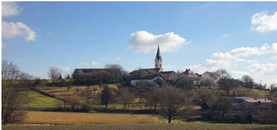
Ein Blick zurück lohnt. Wir schauen auf das von Obstbäumen umgebene Ensemble rund um die Pfarrkirche St. Johannes der Täufer in Weng.