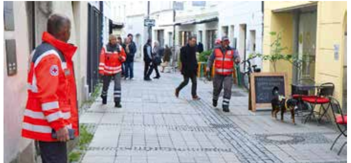
Schnellen Schrittes ging es durch die Altstadt. Von den neugierigen Blicken der Passanten ließ Luna sich nicht ablenken.

sonenspürhund an einer langursprünglich aus dem englischen Sprachraum und wird dort Mantrailer genannt. Diese Hunde folgen der Individualgeruchsspur einer gesuchten Person – dem Trail. Da der Per-