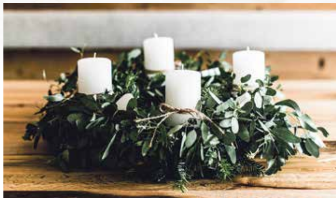
Natürliche Materialien und dezente Farben sind bei Adventskränzen heuer besonders angesagt.

warme, erdige Farben wie Taupe und Naturtöne sehr gefragt, um eine „hyggelige“, von der Natur und aus Skandinavien inspirierte Atmosphäre zu schaffen. Aber auch Schwarz ist angesagt, denn es sorgt für einen starken Touch. Schwarze Adventskranz-Kerzen, Christbaumkugeln oder Deko-Elemente wie Nussknacker gelten daher als besonders trendig. Bei den Materialien und Formen wird ebenfalls viel Wert auf Natürlichkeit gelegt. Sie erinnern häufig an Holz, Eicheln und Blätter. Dabei werden dunklere Holzöne gerne zusammen mit helleren, erdigen Terrakotta-Tönen in Szene gesetzt. Sanfte Kontraste werden mit verschiedenen Blau- und Grüntönen erzielt – vom zarten Eisblau bis hin zum dunklen, an Wald erinnernden Grün sind alle Nuancen vertreten. Aber auch kräftige Farbtupfer können in dieser Saison gesetzt werden. Etwa in Rot-, Grün- oder Goldtönen. Für Gemütlichkeit sorgen zum Beispiel leuchtende Papiersterne sowie Windlicht-Häuschen aus Keramik oder Holz.