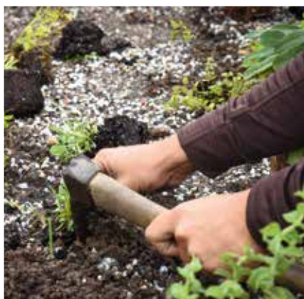
© Freyung 2023 gGmbH Daniela Blöchlinger