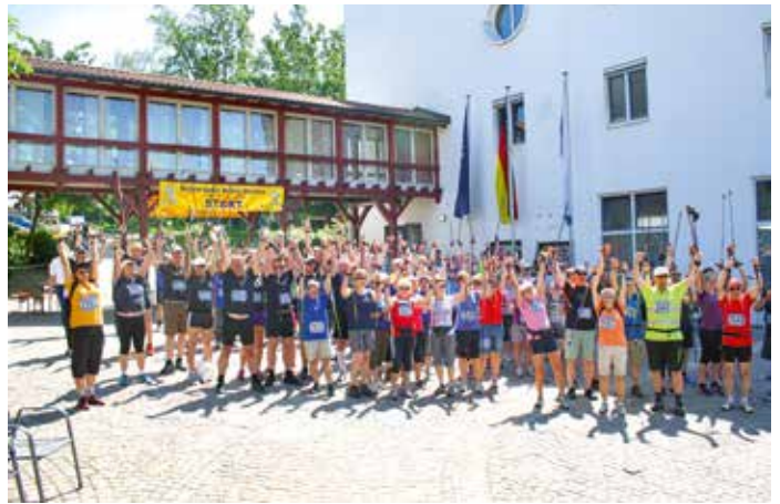
Fertig zum Jubiläumsstart: Am 6. Mai findet der „Rottaler Volksmarathon“ statt und feiert 20. Geburtstag. Als Geschenk gibt's für die Teilnehmer eine Nudelparty und mit dem „Mega Walk 50“ noch eine weitere Strecke zur Auswahl.