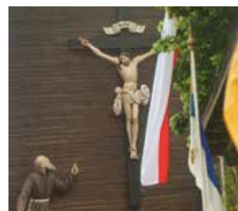
Bruder Konrad Hof Eingang

für Einheimische immer ein lohnendes Ziel ist. Zur großen Freude der Besucherinnen erhielt jede zum Abschluss ein selbstgebackenes Ostersträußchen von der Organisatorin Rita Thomandl.