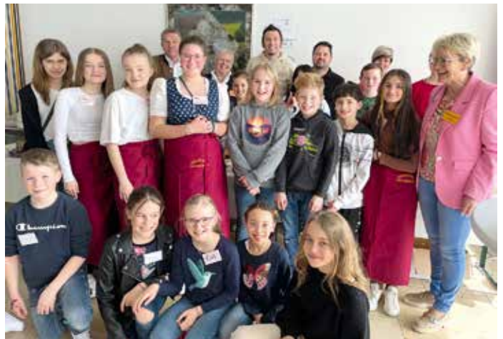
Das gesamte Team hat sich viel Mühe gemacht, damit der „Tag der offenen Tür“ ein voller Erfolg wird.