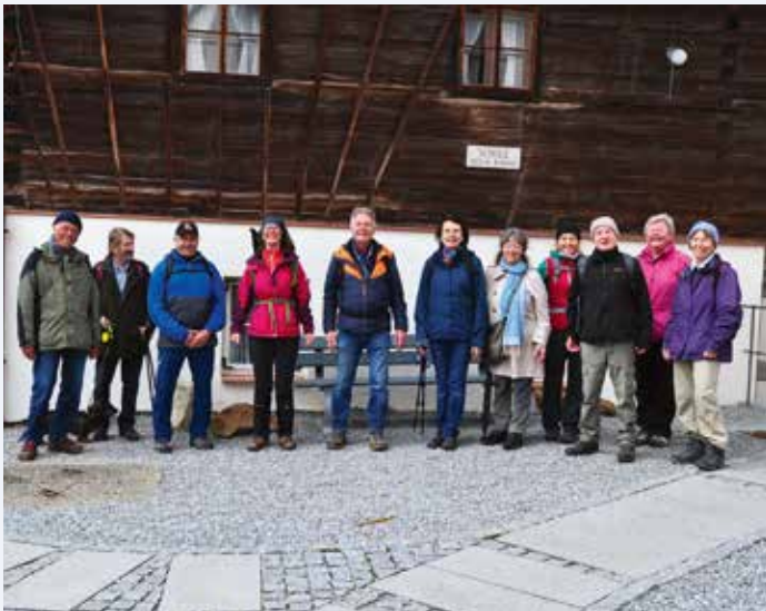
Diese Gruppe traf gerade in Weng ein, wo einst Bruder Konrad von Parzham die Schulbank drückte.

Beim Wandern verhält es sich wohl ähnlich wie beim Golfspielen: Schlechtes Wetter gibt es nicht, höchstens eine schlechte Ausrüstung. Diesen Beweis haben insgesamt 66 Wanderer, Gäste und Einheimische waren gleichermaßen darunter, beim ersten Teil der diesjährigen Wanderwochen angetreten, die Bad Birnbach und Bad Griesbach miteinander ausgerichtet haben, denn auch der Dauer-Regen der letzten Zeit konnte ihnen die Freude an den Touren nicht nehmen. Die beiden Rottaler Kurorte haben durchaus gemeinsame Wurzeln. Ihre Geschichte beginnt beinahe parallel in den 70er-Jahren des letzten Jahrhunderts. Bei allen (natürlich gewollten) Unterschieden gilt: Die beiden Rottaler Kurorte haben bis heute viele Gemeinsamkeiten. Dazu zählt die schöne Gegend zwischen Rott und Inn mit sanften Hügeln, saftig-grünen Auen und unzähligen sehenswerten Kultur-