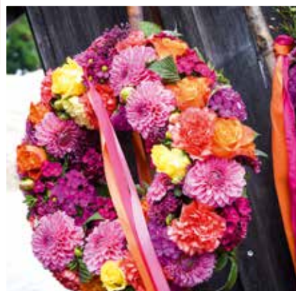
© Freyung 2023 gGmbH Daniela Blöchlinger