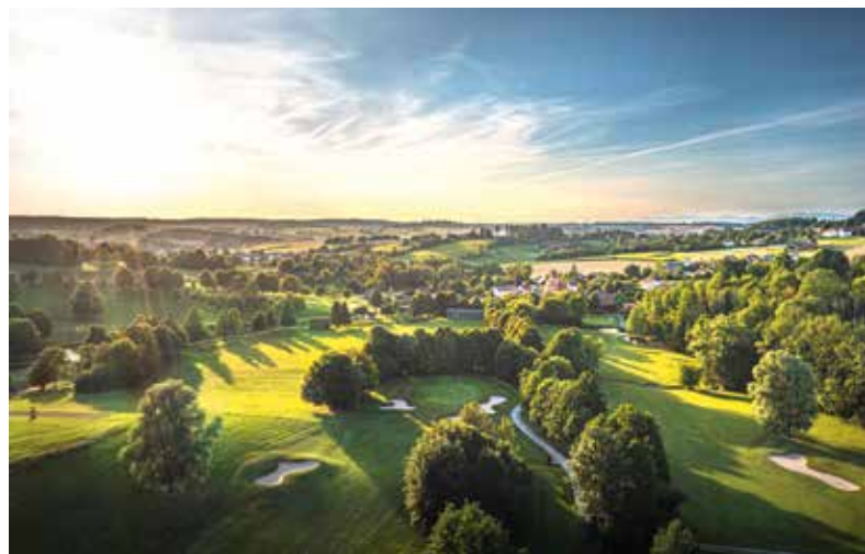
Europas größtes Golf Resort liegt in Bad Griesbach.

für Bad Griesbach zu stellen. Hier läuft der Prozess bereits gut. Mehr kann ich dazu noch nicht sagen. Außer: Es kommen noch tolle Sachen auf Bad Griesbach zu.“