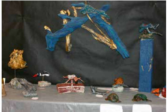
Kleiner Ausschnitt der skurrilen Exponate.